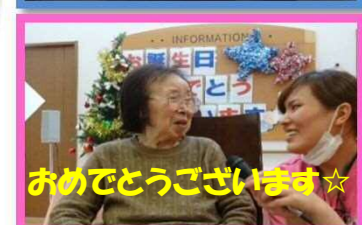
おめでとうございます☆