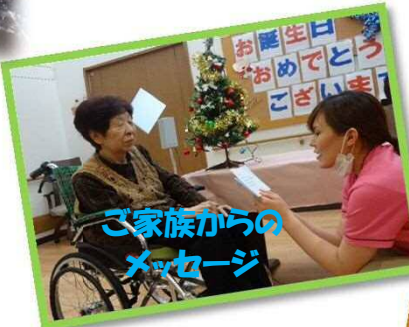
ご家族からのメッセージ