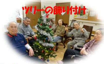
ツリーの飾り付け