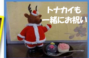
トナカイも一緒にお祝い