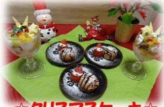
☆クリスマスケーキ☆